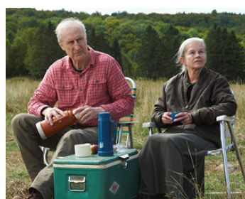
2012 STILL MINE de Michael McGowan avec James Cromwell