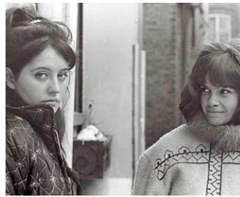
1964 LA FLEUR DE L'ÂGE ou LES ADOLESCENTES de Michel Brault avec Louise Marleau