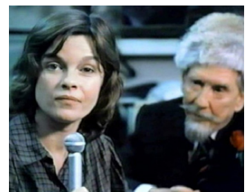
1980 LE DERNIER REPORTAGE (Final Assignment) de Paul Almond avec Burgess Meredith